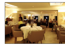
Die Butterblume als Symbol zieht sich wie ein roter Faden...

Ein kleiner, aber behaglicher Lounge-Teil in der Mitte der Räumlichkeiten trennt den vorderen Teil, quasi die Gaststube samt Stammtisch, vom hinteren, wo rund 60 Plätze zum Fine-Dining einladen. Die Speisekarte aber ist auf der einen wie auf der anderen Seite der Lounge dieselbe: Sie vereint Gutbürgerliches mit Schickem, und es gibt – bei allem Käse – kein Fondue, kein Raclette, und die «Eggliflet-Schiene» fahren sie auch nicht, wie der 42-jährige Gastronom Lüthy erklärt.