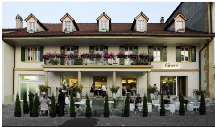
Ob draussen oder drinnen: In der ehemaligen Murtener Chäsi ist heute «Fine-Dining» angesagt.